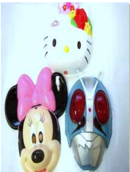
イメージ写真 このお面とは限りません